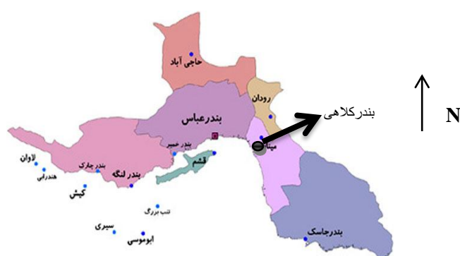
شکل ۱- منطقه نمونه برداری

بندر کلاهی در ۳۰ کیلومتری جنوب غربی شهرستان میناب و در طول جغرافیایی ۵۲°۵۶ شرقی و عرض جغرافیایی ۳۱°۲۷ شمالی واقع شده است. محل نمونه برداری استخرهای پرورش میگوی سفید هندی، واقع در منطقه تیاب بندر کلاهی استان هرمزگان بود.