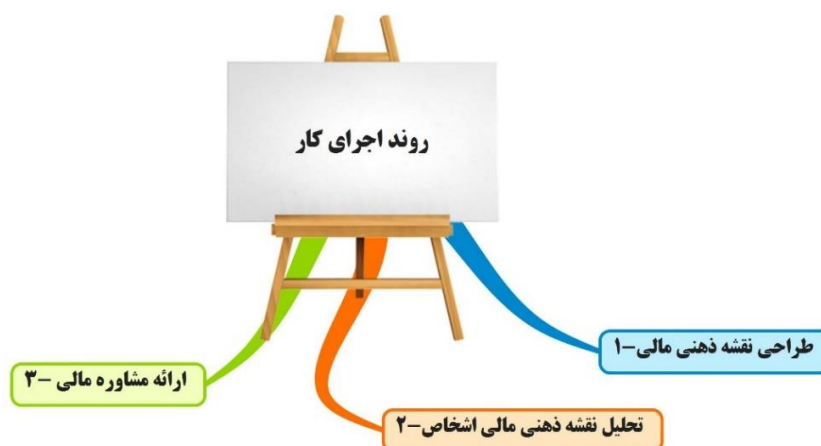
شکل ۵- روند اجرای کار