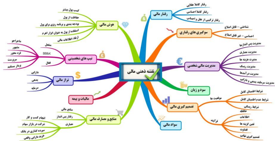
شکل ۶- نقشه ذهنی مالی هوشمند پایه - کامل

مدیریت مالی شخصی، تصمیم‌گیری مالی، هوش مالی، سواد مالی، درآمد‌ها، هزینه‌ها، دارایی‌ها، بدهی‌ها و سرمایه افراد، پس انداز افراد، علایق فردی در نوع به کارگیری/ مصرف پس انداز، ریسک‌ها و بازده‌های موجود، ریسک پذیر بودن یا ریسک گریز بودن افراد، خصلت‌ها و عادت‌های رفتاری، وضعیت اقتصادی اشخاص، داشتن دانش و اطلاعات مالی، ساختار مالی (ساختار سرمایه، دارایی و بدهی و سایر ساختارهای مالی)، پورتفوی مالی (پرتفوی دارایی‌ها، بدهی‌ها، درآمد‌ها، هزینه‌ها) (پرتفوی منابع پس انداز) (پرتفوی مصارف پس انداز)، تجزیه و تحلیل مالی، سرمایه گذاری‌ها، جنسیت، شغل، تحصیلات و سن افراد، تصمیم‌گیری در انسان ترکیبی از عقل و احساس است، تورش‌های رفتاری، عدم تقارن اطلاعاتی.