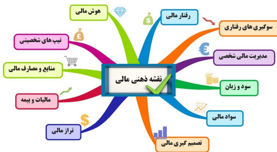
شکل ۴- نقشه ذهنی مالی هوشمند پایه - خلاصه

مدیریت مالی شخصی، بیمه، تیپ‌های شخصیتی سرمایه‌گذاری، تراز مالی، تصمیم‌گیری مالی، سود و زیان، هوش مالی، منابع و مصارف مالی، رفتار مالی و سوگیری‌های رفتاری مالی