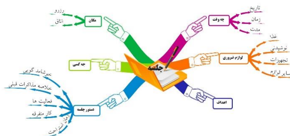
شکل ۱- نمونه‌ای از نقشه ذهنی یک جلسه

یکی از نکات اساسی در راه اندازی کسب و کار موفق، روش استفاده و مدیریت دانش شخصی است و این شرایط زمانی رخ می‌دهد که توانسته باشید مغز خود و روند اندیشه‌های آن را در اختیار بگیرید. نقشه‌ی ذهنی ابزار ترسیمی و دیداری همه جانبه‌ای برای تفکر است که شما را در ارائه‌ی اندیشه‌های نو و خلاقیت به منظور رونق دادن به کسب و کارتان، حل مشکلات، بازبینی روش‌های فروش، سازماندهی یک گروه یا صرفاً ارتقای کیفیت کاری شما به شکل هر روزه یاری می‌کند (بوزان، ۱۳۹۲).