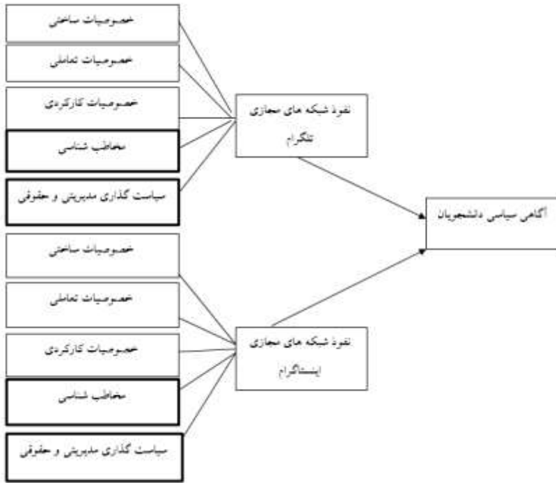
شکل (۲): مدل اکتشافی تحقیق

در دور اول با ۱۳ نفر پاسخگو با ضریب کندال برابر با ۰/۵۹۲ برای دور اول، ۰/۶۴۱ برای دور دوم برابر با ۰/۶۴۸ برای دور سوم رسید. از آنجایی که مقدار ضریب هماهنگی در دور سوم نسبت به دور دوم تنها به میزان ۰/۷ افزایش پیدا کرد و با توجه به اینکه میزان اجماع و اتفاق نظر اعضا در دو دور، رشد قابل توجهی را نشان نداد، لذا به تکرار دوره‌های دلفی پایان داده شد.