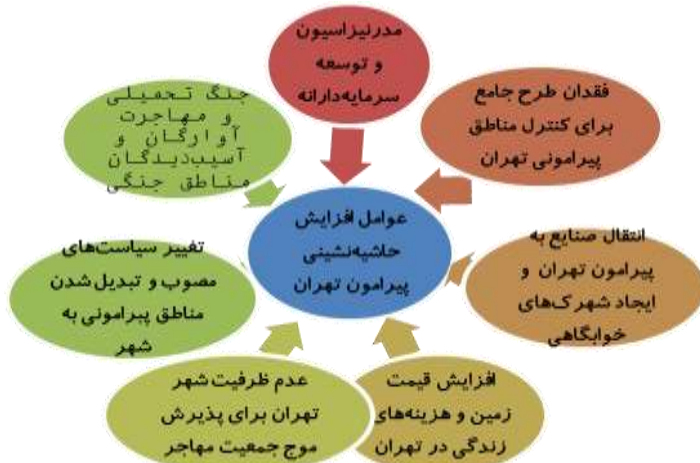
نمودار (۲) عوامل افزایش حاشیه‌نشینی پیرامون شهر تهران

رشد ۴/۷ درصدی جمعیت تهران در فاصله ۱۳۴۵ تا ۱۳۷۵ (جهان‌شاهی، ۱۳۸۴: ۲۹-۳۰) آبادی‌ها و شهرهای کوچک واقع شده در جنوب و غرب تهران را به محل زندگی مهاجران جدید تبدیل کرد و تعداد شهرهای استان تهران از ۴ شهر در سال ۱۳۳۵ به ۱۵ شهر در ۱۳۵۵، ۲۵ شهر در ۱۳۷۵ و ۳۶ شهر در ۱۳۷۶ رسید. (غمامی، ۱۳۸۶: ۲۱) از دهه هفتاد، سیاست‌هایی مانند به رسمیت شناختن مناطق حاشیه‌ای که با هدف ارائه خدمات به ساکنان منطقه صورت گرفت، به عاملی برای توسعه حاشیه‌نشین‌ها تبدیل شد و به‌این‌ترتیب، با شکل‌گیری سکونتگاه‌های متعدد در حاشیه شهر، زمینه‌های شکاف متن و حاشیه پیرامون تهران فراهم شد. متن شهری تهران شامل مناطق مرکزی و بافت قدیمی شهر به اضافه مناطق شمالی به‌عنوان مرکز تجاری - اقتصادی و مسکونی جدید، در مقابل مناطق حاشیه‌ای قرار گرفت که در آن زندگی مهاجران مستضعف روستایی، کارگران روزمزد، فعالان در مشاغل خدماتی سطح پایین، در سکونت‌گاه‌های فاقد امکانات شهری استقرار یافت و در ادامه روند سیل مهاجران و تراکم جمعیت در مناطق اطراف، الگوی مرکز - پیرامون بر رابطه تهران و مناطق حاشیه‌ای حاکم شد (شیخی، ۱۳۸۵: ۷۹).