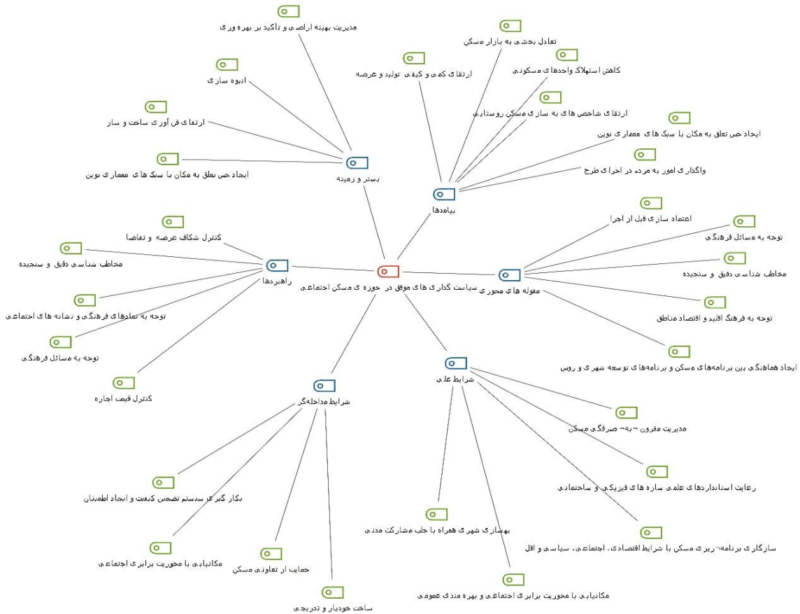
شکل (۱) مدل مفهومی بر اساس نرم افزار مکس کیو دی ای