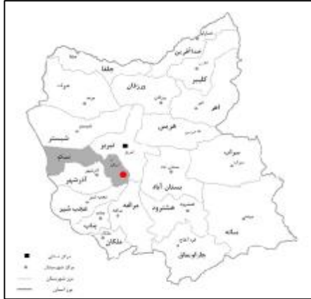
شکل 14: موقعیت جغرافیایی در شهرستان اسکو