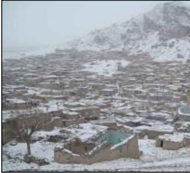
شکل 9: اقلیم کوهستانی و سرد روستا