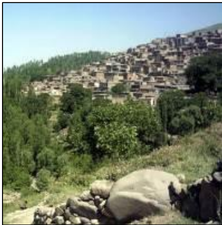
شکل 17: اقلیم معتدل و کوهستانی روستا