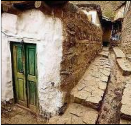
شکل 13: معابر شیبدار روستا