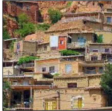
شکل 12: خانه های پلکانی روستا