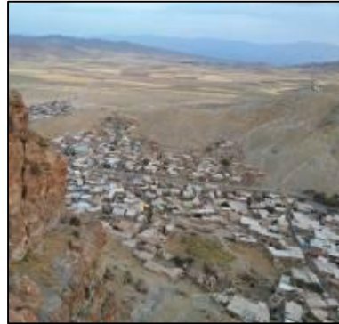
شکل 8: قرارگیری روستا در پهنه کوه