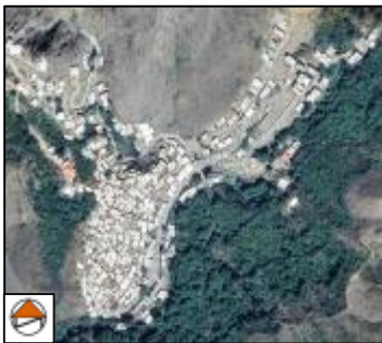
شکل 11: عکس هوایی اشتتین

این روستا در شمال غربی استان واقع شده و از توابع بخش شهرستان جلفا می‌باشد. بنابر اطلاعات خانه بهداشت، این روستا بالغ بر 1034 نفر جمعیت، 295 خانوار و در حدود 341 واحد مسکونی دارد. این تعداد جمعیت شامل 532 نفر مرد و 502 نفر زن می‌باشد. روستای اشتتین دارای خانه‌هایی با معماری پلکانی است، به طوری که حیاط یک خانه سقف خانه‌ای دیگر می‌باشد. انواع معیشت موجود در روستا عبارت است از کشاورزی، دامداری، دامپروری و صنایع دستی. روستای اشتتین در 17 خرداد 1379 هجری خورشیدی با شماره ثبت 2692 به عنوان یکی از آثار ملی ایران به ثبت رسیده است و همچنین مقبره ابوالقاسم نباتی، شاعر نامدار آذربایجان، روی تپه‌ای در پایین‌ترین قسمت روستا قرار دارد و یکی از آثار تاریخی روستای اشتتین محسوب می‌شود (طرح هادی روستای اشتتین، بنیاد مسکن انقلاب اسلامی استان آذربایجان شرقی). بعد خانوار این روستا 3/51، نرخ باسوادی آن 81/65 درصد و نرخ بیکاری در آن 3/13 درصد می‌باشد (طرح هادی روستای اشتتین، بنیاد مسکن انقلاب اسلامی استان آذربایجان شرقی).