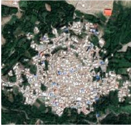
شکل 15: عکس هوایی گنبرف