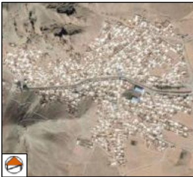
شکل 7: عکس هوایی گلین قیه

این روستا در شمال غربی استان و جنوب غربی شهر مرند واقع شده است. روستای گلین قیه در فاصله 5 کیلومتری از جاده مرند-جلفا قرار دارد. بر اساس سرشماری سال 1395 جمعیت این روستا شامل 1990 نفر، 682 خانوار و 641 واحد مسکونی می‌باشد. براساس اطلاعات جمعیت‌شناسی، این روستا دارای 2/92 بعد خانوار و 89/79 درصد نرخ باسوادی و 3/15 درصد نرخ بیکاری است (طرح هادی روستای گلین قیه، بنیاد مسکن انقلاب اسلامی استان آذربایجان شرقی).