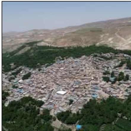
شکل 16: قرارگیری روستا در پهنه کوه