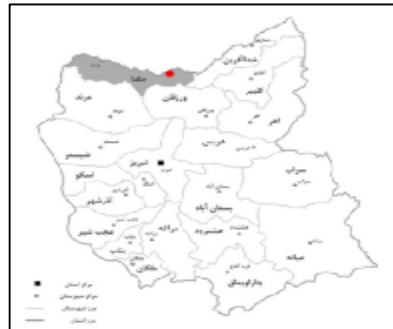
شکل 10: نقشه قرارگیری شهرستان جلفا