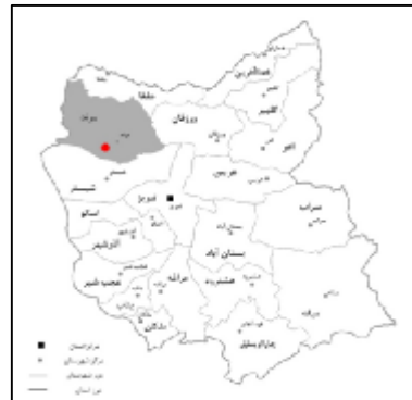
شکل 6: نقشه شهرستان مرند