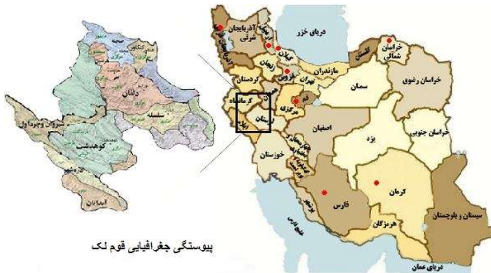
شکل (۲): پیوستگی جغرافیایی قوم لک

استان‌های شمالی پراکنده‌اند. اما تمرکز جمعیت و پیوستگی جغرافیایی آن‌ها در چهار استان لرستان، کرمانشاه، ایلام و همدان می‌باشد که در نقشه زیر به نمایش گذاشته شده است. نقاط مشخص شده در برخی استان‌ها نشان پراکندگی قوم لک در گستره ایران می‌باشد.