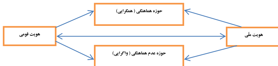
شکل (۱): مدل نظری تحقیق

با عنایت به پیوستگی و تداوم هویت‌های قومی و هویت ملی به معنای هویت‌های جمعی در سطوح میانه و کلان، مدل نظری تحقیق که بیانگر روابط میان متغیرهای پژوهش است به شکل زیر می‌باشد.