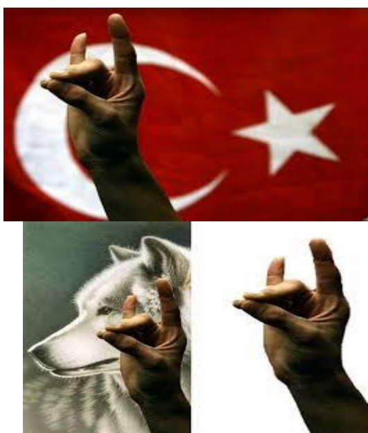
« نماد بوزقورد »

هرچند در این خصوص افسانه های مختلفی ذکر شده است، لیکن بیشتر این افسانه بر سرزبان ها افتاده است که نسل جدید ترک از وصلت پسرک ترک با گرگ پا به عرصه وجود می‌نهد و در نسل‌های بعدی آنها عاقبت امپراطوری عظیم "گوک ترک" یا "ترکان آسمانی" (ترک های آبی) را از دریای چین تا دریای سیاه بنا می‌نهند. (مدرسی و دیگری، ۱۳۹۱: ۹۵)