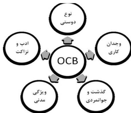
شکل ۱- مدل رفتار شهروندی سازمانی ارگان و گرهام

با توجه به اینکه در این پژوهش از یک سو بررسی رابطه بین رفتار شهروندی سازمانی با رضایتمندی مراجعان مد نظر است و از سوی دیگر تأثیر کیفیت خدمات بر رضایتمندی مراجعان مورد بررسی قرار می‌گیرد، مدل مفهومی تحقیق با توجه به بررسی مدل‌های مختلف تحقیقات پیشین به صورت شکل ۱ تدوین شده است که در آن، مولفه‌های رفتار شهروندی سازمانی ارائه شده از مدل رفتار شهروندی سازمانی ارگان و گرهام اقتباس شده است زیرا این مدل‌ها توجه محققان زیادی را از زمان ارائه آن‌ها تاکنون به خود جلب کرده‌اند. ضمناً مدل رضایتمندی تحقیق (شکل ۲) نیز از مدل مطالعات پاراسرمن و همکاران (1998) اقتباس شده است.