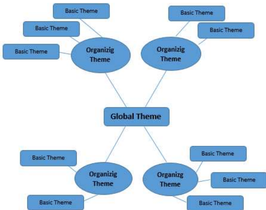
(Attride-Stirling, 2001: 388). FIGURE 1. Structure of a thematic network

مراحلی که برای یافتن شبکه‌ی مضمونی لازم است طی شود در جدول نشان داده شده است. تحلیل شبکه مضمونی را می‌توان به طور کلی به سه بخش اصلی تقسیم نمود: اول تجزیه متن، دوم اکتشاف متن و سوم یکپارچه کردن اکتشاف‌ها (Attride-Stirling, 2001: 391)