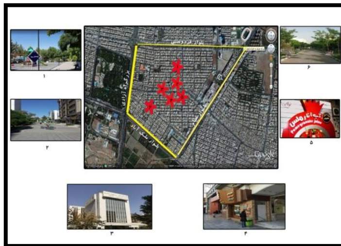
تصویر ۳- نقاط شاخص محدوده