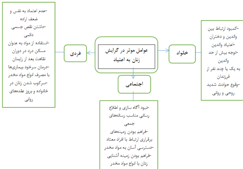
شکل شماره (۲) مدل تحقیق: عوامل اصلی و مؤلفه‌های مؤثر بر گرایش زنان به اعتیاد به مواد مخدر

براساس هدف پژوهش حاضر، مدل تحقیق در شکل شماره (۲) عوامل اصلی و زیر مولفه‌هایی که موجب گرایش زنان به سمت اعتیاد را موجب می‌شوند نشان می‌دهد. که در این پژوهش قصد داریم به بررسی و ارایه مدل تحلیل عاملی با استفاده از نرم‌افزار Amos پردازیم.