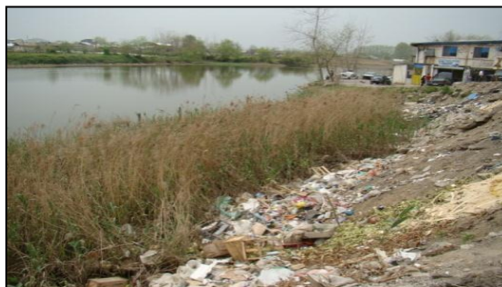
شکل ۳. عدم شیوه دفع مناسب زباله در محله عینک رشت

در خصوص میزان برخورداری از خدمات زیربنایی به شیوه برداشت پلاک به پلاک آمارها به شرح زیر می‌باشد. میزان برخورداری از آب لوله کشی شهری ۴۵/۷۲ درصد، برق ۸۵/۶۴ درصد، گاز ۸۰/۹۳ درصد و تلفن ۸۲/۳۵ درصد می‌باشد. در محله استخر عینک ۵۵/۷ درصد از جامعه آماری وضعیت فاضلاب را نامناسب می‌دانند. ۵۰/۵ درصد از خانوارها در مواقع بارندگی دچار آبگرفتگی در کوچه و خیابان می‌شوند. ۹۲/۲ درصد از خانوارهای محله استخر عینک در بررسی پیمایشی اظهار داشتند که جمع آوری زباله‌ها توسط شهرداری صورت می‌گیرد اما این کار چند روز یکبار انجام می‌گیرد.