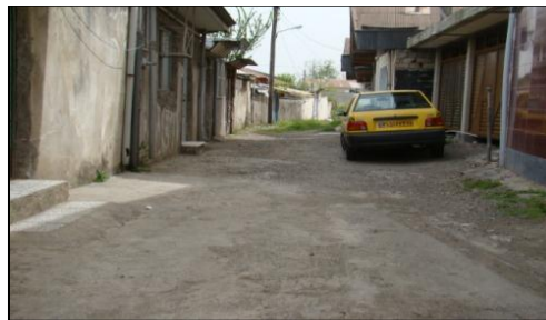
شکل ۲. نمایی از شبکه معابر در محله عینک رشت