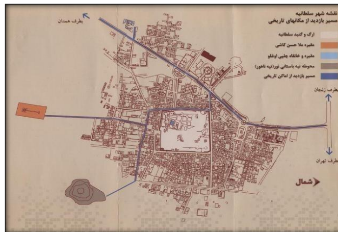
شکل ۲. شهر سلطانیه و محل گنبد سلطانیه (منبع: http://hms.soltaniepnu.ac.ir )