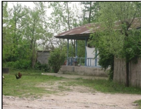
شکل ۴. نمایی از تخریب اراضی کشاورزی و تبدیل آن به واحدهای مسکونی