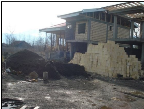
شکل ۳. اختصاص مساحت زیاد به کاربری مسکونی در روستاهای جلگه‌ای