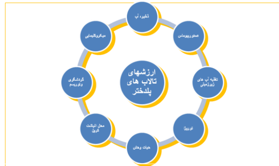
شکل ۱. ارزش‌های تالاب‌های ۱۱ گانه شهرستان پلدختر

در جنوب استان لرستان به عنوان شهر تالاب‌های لرستان مشهور می‌باشد. قبل از هر استفاده‌ای از یک منبع، آگاهی از قابلیت‌ها و توان آن منبع ضروریست، تا سیاست‌گذاری و برنامه‌ریزی بر اساس توان منبع به صورت پایدار انجام شود. تالاب‌های پلدختر دارای ارزش‌های فراوانی هستند که یکی از این قابلیت‌ها تالاب ارزش‌های گردشگری و اقتصادی تالاب می‌باشد. تالاب‌های پلدختر با داشتن چشم‌اندازهای متنوع طبیعی از جمله کوه‌های اطراف در فاصله ده متری و مراتع و کشتزارهای سرسبز جاذبه‌های توریستی بالایی دارند. سیمای طبیعی زمین متشکل از تمام اجزای است که منظر یک مکان ویژه از یک منطقه را بوجود می‌آورند تالاب‌ها از اجزای کلیدی سیمای طبیعی زمین بشمار می‌روند که نه تنها باعث تنوع بلکه نقطه محوری منطقه نیز محسوب می‌شوند.