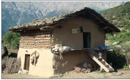
شکل ۲. کارکردهای مسکن سنتی - روستای بالابند