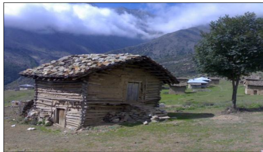
شکل ۳. مسکن دارورچین، روستای بالابند

مسکن دارورچین: این نوع مسکن در سازگاری کامل با اقلیم و نوع فعالیت اقتصادی حاکم بر محدوده مورد مطالعه است که در نواحی کوهپایه‌ای و کوهستانی و محدوده‌هایی که به جنگل نزدیک است، ساخته می‌شوند. کلمه دارورچین از سه لغت دار، به معنی درخت و ور به معنی پهلوی و چین به معنی چیدن تشکیل شده است. ساخت دارورچین اغلب به صورت یک اتاقی با بام لته‌سر اجرا می‌شود. مسکن با دیوار دارورچین و بام لته‌سر محل سکونت کوه‌نشینان است. با توجه به جدول (۱)، روستاهای تالش سرا، نمکدره، نوشا، پیازکش و خانیان بیشترین درصد را در این نوع مسکن دارا می‌باشند و کمترین درصد در روستاهای جواهرده، کنسکوه، جنت رودبار، امامزاده قاسم، لتر و تودارک مشاهده می‌شود که نشان‌دهنده تحولات ناچیز در این روستاهاست. دلیل عمده آن ناشی از دور بودن از مسیر ارتباطی اصلی می‌باشد. در روستاهای نمونه ۲۹ درصد مسکن از نوع دارورچین می‌باشد. نمونه و نحوه ساخت این نوع مسکن را می‌توان در ترکیه به خصوص در منطقه بولو و حوالی آن که ساخت این نوع مسکن به جهت وجود جنگل‌های فراوان، متداول است، مشاهده نمود.