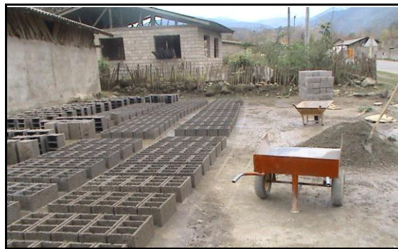
شکل ۵. مسکن جدید (بلوکه)، روستای لیره سر

مسکن جدید (بلوکه): این مسکن به تقلید و الگوبرداری از مسکن غیر بومیان در محدوده مورد مطالعه ساخته شده که از مصالح جدید و با فونداسیون پرهزینه و مقاوم می‌باشد. در واقع یکی از جنبه‌های تأثیرگذاری افراد غیر بومی، تحول در نوع و شکل ساخت مسکن است. از آنجایی که تعداد گردشگران بسیار زیاد می‌باشد و همه دارای مسکن شخصی نیستند، جهت اقامت خود مسکن روستایی را اجاره می‌کنند و این عامل انگیزه‌ای برای روستاییان جهت ساخت مسکن به سبک جدید با مصالح جدید، شکل‌تر و با وسایل رفاهی بیشتر و اجاره آن به گردشگران ایجاد نموده است. به علت تغییر کارکردها، شکل فرم مسکن نیز تغییر یافته است. به طوری که مسکن به صورت یک طبقه و یا اگر دو طبقه بنا شده باشد، طبقه همکف آن به جای اختصاص به دام به عنوان یک اتاق و فضای اضافی برای استراحت خانواده به خصوص در فصول گرم که ممکن است طبقه دوم را اجاره دهند و یا جهت انبار کردن محصولات و ابزار کشاورزی و وسایل اضافی منزل، به عنوان انباری استفاده شود. با توجه به جدول (۱)، تعداد این مسکن در روستاهای نمونه ۳۳ درصد از مسکن را به خود اختصاص داده‌است.