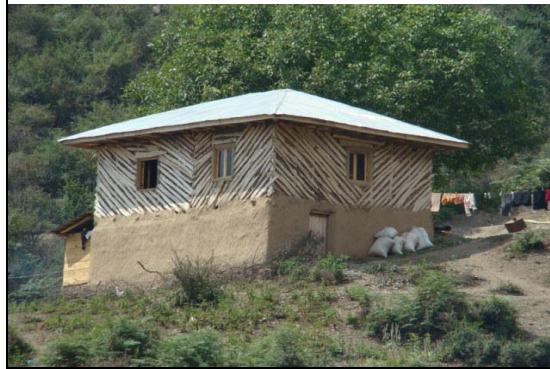
شکل ۴. مسکن زیگامه، روستای کوهسر

شکل کامل‌شده‌ای از مسکن دارورچین می‌باشد که پس از یکجانشین شدن به صورت دائم آن را تغییر داده‌اند. با توجه به جدول، روستاهای کوهسر، کنسکوه، لتر و پیازکش بیشترین تعداد را در این نوع مسکن دارا می‌باشند. مسکن زیگامه در روستاهای مورد مطالعه حدود ۳۵ درصد مسکن را شامل می‌شوند.