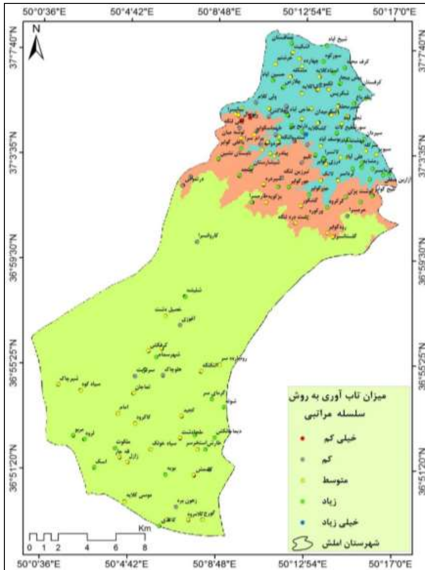
شکل ۳. مدل نهایی میزان تاب‌آوری روستاهای شهرستان املش نسبت به پدیده زمین‌لغزش با استفاده از روش تحلیل سلسله مراتبی

میزان تاب‌آوری روستاها با روش تحلیل سلسله مراتبی در ۵ طبقه خیلی کم (ارزش ۳)، کم (ارزش ۴)، متوسط (ارزش ۵)، زیاد (ارزش ۶) و خیلی زیاد (ارزش ۷) خلاصه شده است. با توجه به جدول (۶)، درصد روستاهای با تاب‌آوری خیلی کم، کم، متوسط، زیاد و خیلی زیاد به ترتیب برابر با ۱/۳۹، ۱۵/۹۶، ۴۵/۸۳، ۳۶/۱۳ و ۰/۶۹ محاسبه شد. بعبارت دیگر ۶۳/۱۸ درصد روستاهای این ناحیه دارای تاب‌آوری متوسط به پایین و ۳۶/۸۲ درصد آنها دارای تاب‌آوری زیاد و خیلی زیاد هستند. همچنین توزیع درصد فراوانی تاب‌آوری روستاها براساس قرارگیری آنها در ناحیه جلگه‌ای، کوهپایه‌ای و کوهستانی نتایج دقیق‌تری را بدست می‌دهد، بطوریکه درصد روستاهای با تاب‌آوری خیلی کم، کم، متوسط، زیاد و خیلی زیاد در ناحیه جلگه‌ای برابر با صفر، ۴/۱۶، ۲۲/۹۲، ۲۰/۱۴ و ۰/۶۹ درصد، در ناحیه کوهپایه‌ای برابر با ۱/۳۹، ۶/۹۴، ۸/۳۳، ۶/۹۴ و صفر درصد و در ناحیه کوهستانی برابر با صفر، ۴/۸۶، ۱۴/۵۸، ۹/۰۵ و صفر درصد از درصد کل، روستاهای شهرستان املش را در بر می‌گیرند. در نتیجه روستاهای با تاب‌آوری متوسط به پایین در ناحیه جلگه‌ای (۲۷/۰۸ درصد) بیشتر از دو ناحیه دیگر (۱۶/۶۶ و ۱۹/۴۴ درصد) بوده و این مهم در مورد روستاهای با تاب‌آوری زیاد و خیلی زیاد هم صدق می‌کند. با توجه به سهم روستاهای واقع در هر سه ناحیه یعنی ۴۶/۹۱، ۲۳/۶ و ۲۸/۴۴ درصد، نتیجه‌گیری فوق‌تر از انتظار نخواهد بود.