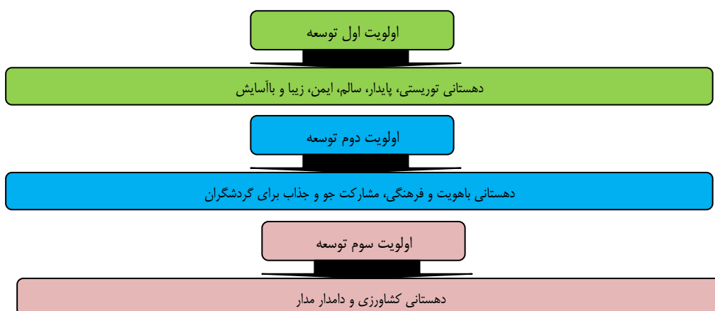
شکل ۳. اولویت‌های توجه بر چشم‌اندازسازی توسعه دهستان