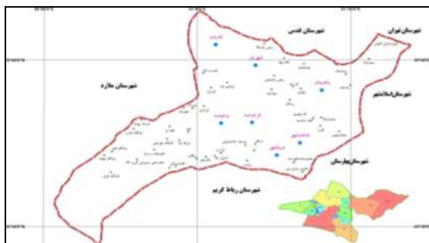
شکل ۲. پراکندگی شهرها و روستاهای شهرستان شهریار