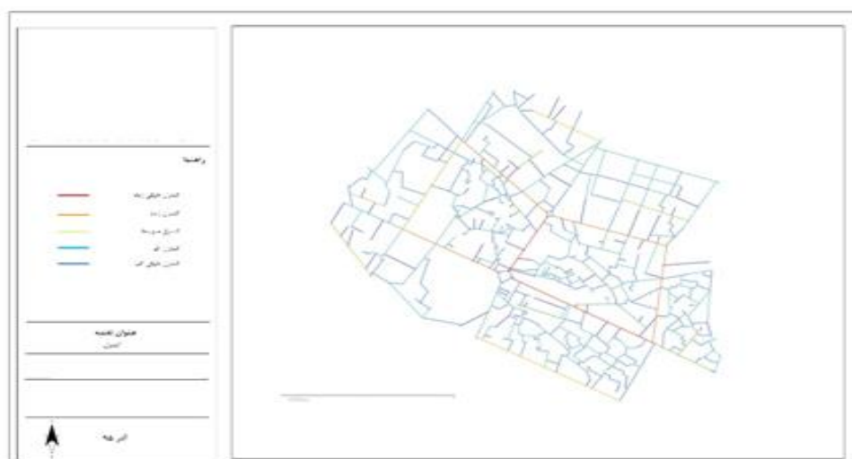
شکل ۴. نقشه کنترل خیابان

مفهوم کنترل را می‌توان بامعنای گزینش در ارتباط دانست به عبارت دیگر مقدار کنترل بیان‌کننده احتمال گزینش یک فضا در یک گره شهری است. مثلاً در یک تقاطع به شکل چهارراه، احتمال گزینش هر یک از مسیرها (فضاها) برابر 0/۲۵ است که برابر با مقدار کنترل آن‌ها است. هرچه مقدار کنترل بیشتر باشد امکان گزینش فضای شهری توسط مخاطبان آن بیشتر خواهد بود (یزدانفر، موسوی، زرگردقیق، ۱۳۸۸، ۶۹). با توجه به شکل (۴) رنگ‌های گرم نشان‌دهنده کنترل بیشتر و رنگ‌های سرد نشان‌دهنده کنترل کمتری می‌باشد. در نتیجه به این مفهوم پی می‌بریم که رنگ‌های گرم‌تر احتمال گزینش بیشتری در این فضا دارند.