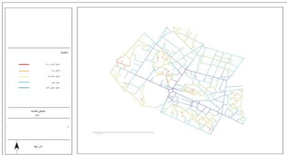
شکل ۵. نقشه عمق خیابان