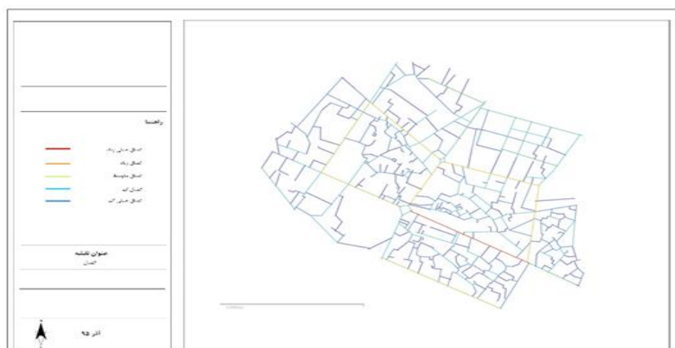
شکل ۳. نقشه اتصال خیابان