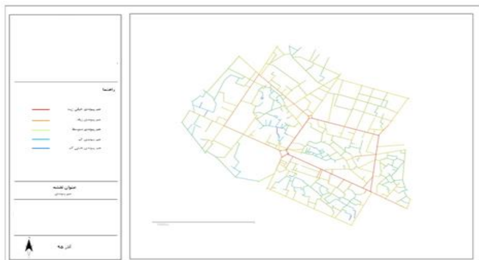
شکل ۶. نقشه هم پیوندی خیابان

گفته می‌شود فضای کوچک مقیاس بیش‌تر هم پیوند است، اگر دیگر فضاها بتوانند پس از پیمودن تعداد کمی از فضاها میانی به آن دست یابند. فضا کم‌تر هم پیوند است، اگر تعداد فضای لازم میانی افزایش یابد. این ایده با هم پیوندی فراگیر اندازه‌گیری می‌شود. هم پیوندی می‌تواند بر اساس عمق متوسط هم محاسبه شود (Igbal, 2010:13). دیگر پارامتر مورد استفاده در تحلیل پیکربندی فضایی، پارامتر هم پیوندی است. هم پیوندی مطابق با مفهوم انسجام فضایی است. هر چه میزان هم پیوندی بیشتر باشد به معنای آن است که یکپارچگی بیشتری بین فضای مورد بررسی و دیگر فضاها و تحت مجموعه، کلیت فضایی وجود دارد همچنین این پارامتر بیان‌کننده میزان دسترسی نیز می‌باشد یعنی فضایی که از بیشترین میزان هم پیوندی برخوردار است نسبت به دیگر فضاها بیشترین میزان دسترسی را نیز داراست. این گونه فضاها بیشتر شامل تجاری و دسترسی‌های اصلی شهر می‌شود (یزدانفر، موسوی و زرگردقیق، ۱۳۸۸: ۶۱). با استفاده از نرم‌افزار اسپیس سینتکس مشاهده می‌شود در شکل (۶) هم پیوندی فراگیر محدوده مورد مطالعه، تعدادی از مسیرها دارای رنگ‌های گرم‌تری از سایر مسیرهای محدوده است. این خطوط بیشترین مقادیر هم پیوندی فراگیر را دارند. بدین ترتیب می‌توان گفت این مسیرها نسبت به دیگر مسیرهای محدوده قابل دسترسی‌ترند و موجبات هم پیوندی فضایی را در بافت بر عهده‌دارند.