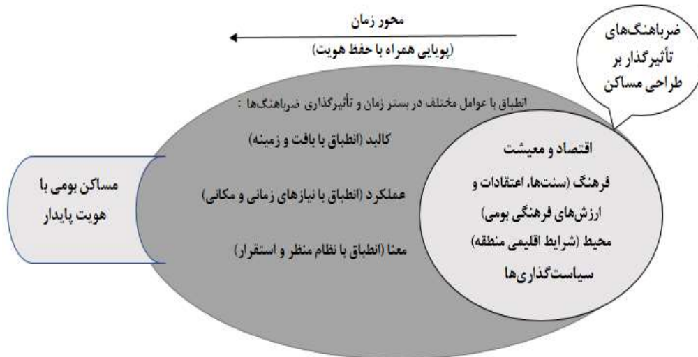
شکل ۱. پایداری مسکن بومی در بستر زمان و شرایط زمینه‌ای همزمان با تأثیرگذاری ضرباهنگ‌ها

با توجه به مبانی نظری و اهداف تحقیق می‌توان مدل مفهومی تحقیق را با توجه به عناصر هویت‌ساز پایدار مسکن بومی در بستر زمان و تأثیرگذاری ضرباهنگ‌های مختلف به شرح شکل (۱) ترسیم نمود.