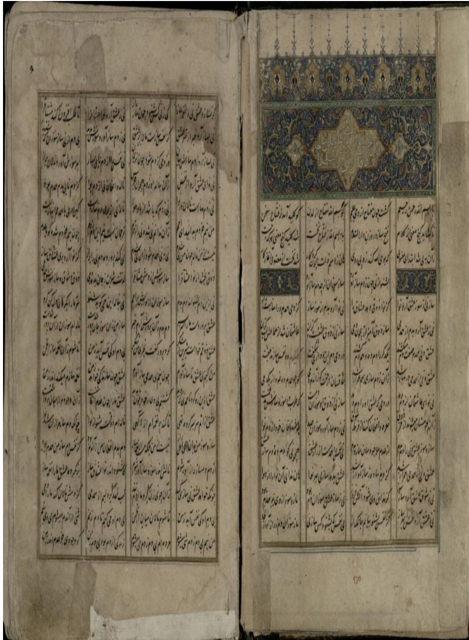
شکل ۲: تصویر شروع نسخه