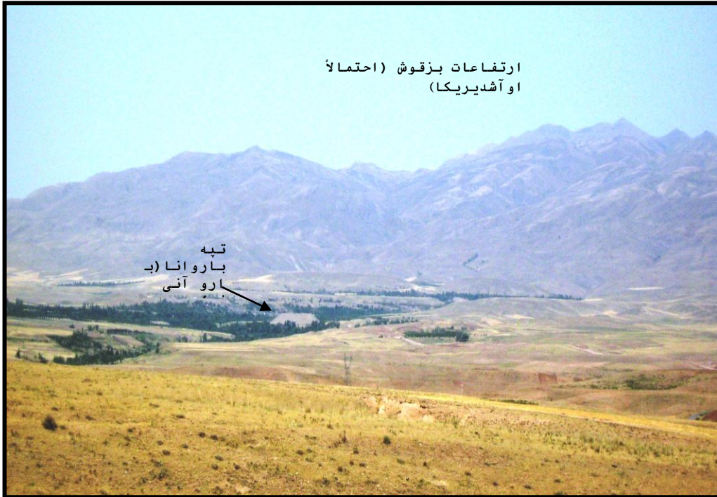
تصویر ۴- دامنه جنوبی ارتفاعات بزقوش و تپه باروانا، میانه