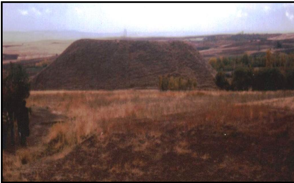
تصویر ۵- نمای غربی تپه باستانی باروانا، میانه