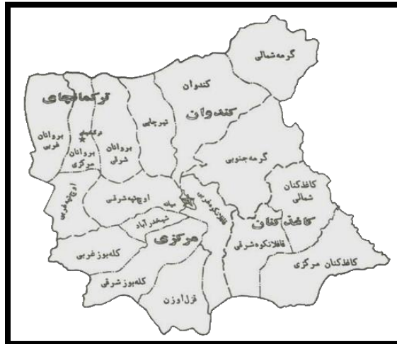
تصویر ۲- نقشه شهرستان میانه