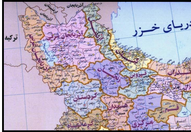
تصویر ۱ نقشه شمال غرب ایران و مناطق برامونی