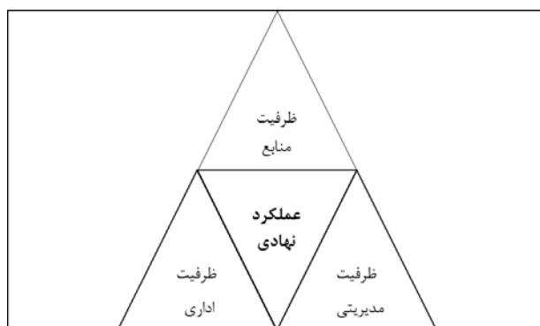
شکل ۱: ابعاد ظرفیت برای عملکرد نهادی

و بافت‌های تاریخی و قدیمی شهر با معماری سنتی و چشم‌نوازشان یکی از عناصر گردشگری شهری محسوب می‌شوند. نهادهای محلی به خصوص نهادهایی که در زمینه گردشگری و محیط‌زیست فعال هستند می‌توانند سرمایه‌گذاران را به سوی سرمایه‌گذاری در محورهای تاریخی شهر سوق دهند. بافت‌های تاریخی کانون و هسته شهرها هستند. حیات این بافت‌ها طی سده‌های گذشته پایه بسیاری از آداب و رسوم و حتی فرهنگ موجود و نیز رونق اقتصادی شهر و منطقه بوده است. فضاهای تاریخی شهری قبل از همه وظیفه دارند تاریخ، هویت عینی و ذهنی شهر را حفظ کنند و در زندگی جاری سازند. پاسدار همه خاطرها و یادمان‌ها بوده و از این رو باید فعالیت‌هایی را در کالبد خود جای دهند که با هدف یاد شده انطباق یابد. چنین فضاهایی با توسعه فعالیت‌ها و فضاهای گردشگری در حفظ بناها و عناصر تاریخی خود موفق می‌شوند و حضور شب و روز شهروندان و گردشگران را امکان‌پذیر می‌سازند. نهادهای محلی می‌توانند از این ظرفیت خود استفاده نمایند و با جلب و حضور مشارکتی مردم، جوانان و نوجوانان در جشن‌ها، انواع گردهمایی‌های اجتماعی، برپایی نمایش‌ها اشکال گوناگون تعاملات اجتماعی و فرهنگی و هر آن چه که مظهر تنوع فرهنگی و قومی یک ملت بزرگ با تاریخ هزاران ساله است را معرفی نمایند (Kalantari va hamkaran, ۱۳۹۴: ۱۰).