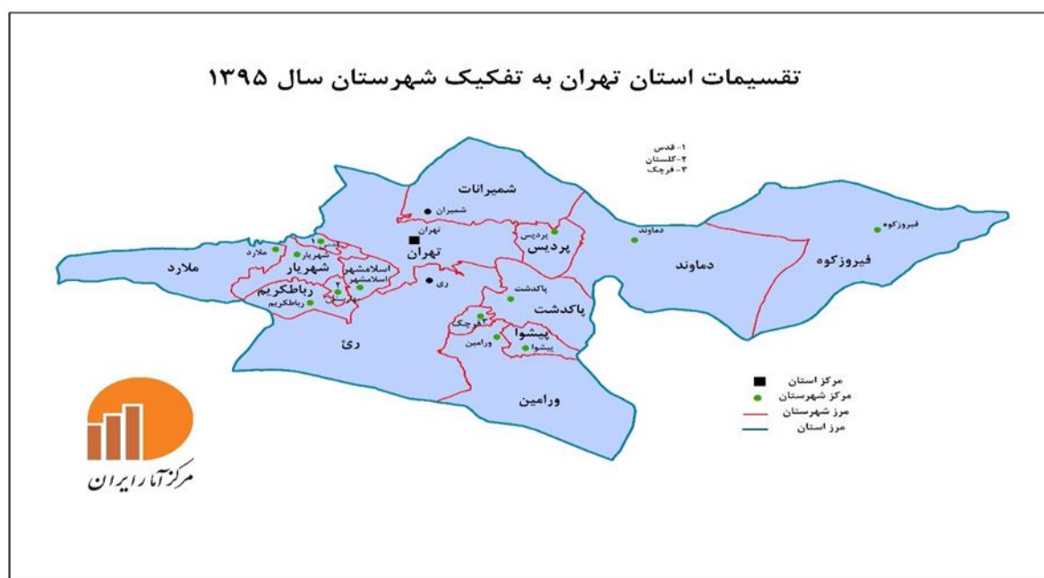
نقشه شماره ۲: نقشه استان تهران به تفکیک شهرستان (www.amar.org.ir)

استان تهران طبق سرشماری سال ۱۳۹۵ بیش از ۱۲ میلیون نفر جمعیت دارد و به دلایلی چون: مرکزیت سیاسی و اداری کشور، تمرکز فعالیتهای اقتصادی و صنعتی، تراکم و تمرکز بالای جمعیت، دسترسی به شبکه حمل و نقل و راه‌های ارتباطی (مرکز تلاقی خطوط راه آهن، جاده ای و هوایی (و تمرکز مؤسسات مالی و اعتباری و بانکی در تهران یکی مهم‌ترین استان‌های کشور است (malekmahmoodi va hamkaran, 1391)