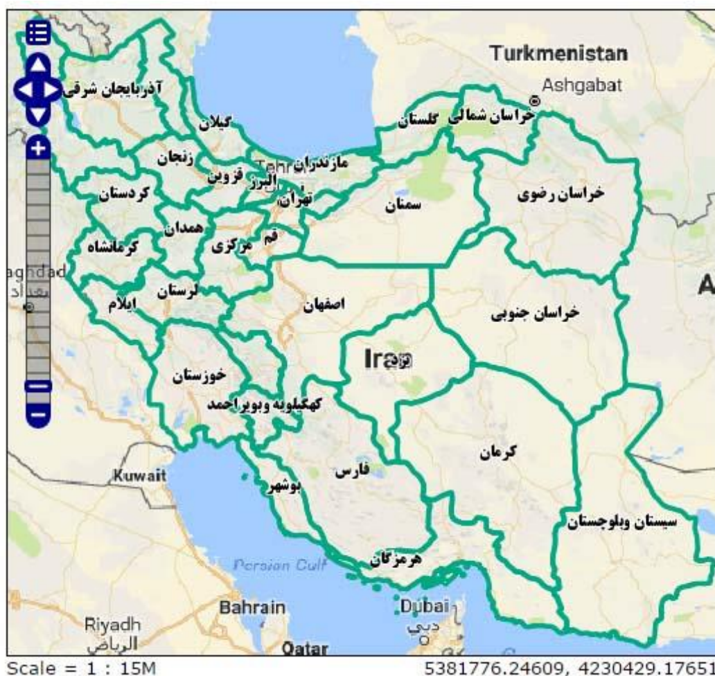
نقشه شماره ۱: نقشه ایران ( http://tsm.ncc.org.ir )

شده است که با جداسازی فضاها و اختصاص فضاهای مخصوص بانوان به نوعی امکان بهره گیری آنها از برخی فضاها تسهیل و افزایش یابد.