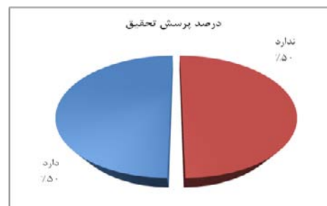
نمودار شماره ۲: وجود پرسش در تحقیق