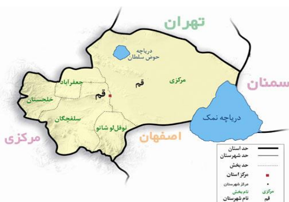
نقشه (۲) تقسیمات کشوری استان قم به تفکیک شهرستان در سال ۱۳۸۸

جمله دشت قم دارای آب وهوای نیمه بیابانی و نواحی شرقی استان دارای آب وهوای گرم و خشک بیابانی می‌باشند.