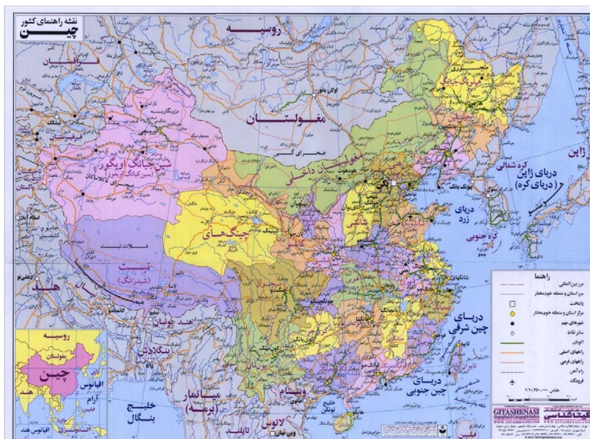
نقشه شماره ۱: نقشه کشور چین