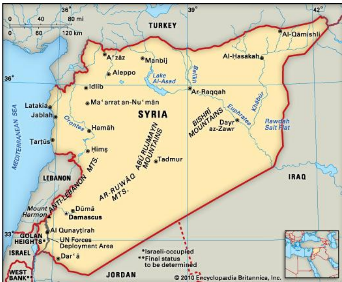
نقشه شماره ۱- ژئوپلیتیک سوریه

ژئوپلیتیک سوریه ۱ به شکلی است که جایگاه راهبردی به این کشور بخشیده است؛ قرار گرفتن این کشور در نقطه اتصال سه قاره آسیا، اروپا و آفریقا باعث شده این کشور به عنوان یک بازیگر میان اروپای صنعتی و خاورمیانه ۲ به ایفای نقش بپردازد (Ayorloo, 2011: 56).