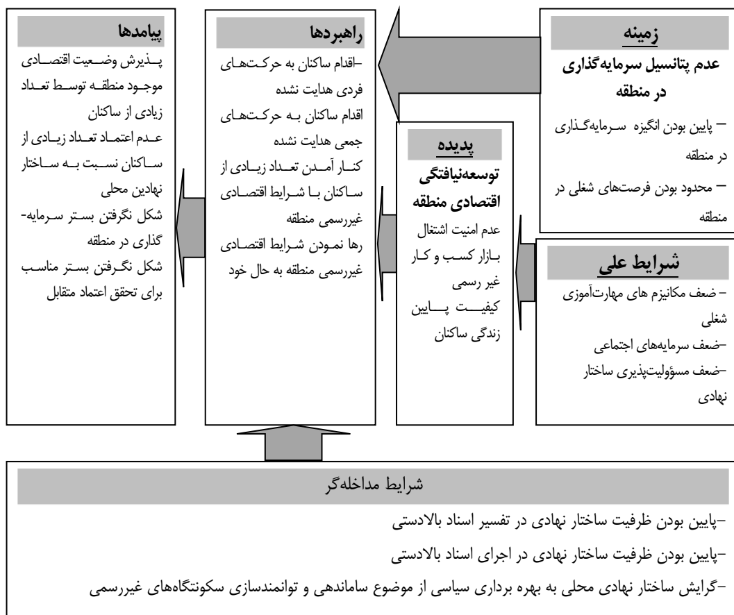
شکل ۲: مدل پارادایمی