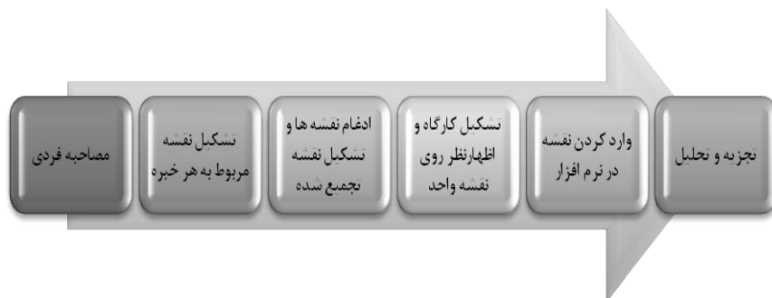
شکل ۱- مراحل روش تحلیل و توسعه گزینه‌های استراتژیک (فخیمی آذر، مالک و

سازمانی را در قالب این مدل مورد بررسی و تجزیه و تحلیل قرار داد. با استفاده از این مدل عوامل دخیل در یک مساله در قالب سه دسته از عوامل (رفتاری، ساختاری و زمینه‌ای) مورد بررسی قرار می‌گیرد (میرزایی، طالقانی و سعدآبادی، ۱۳۹۲). لذا در این پژوهش نیز با بهره‌گیری از این مدل به تجزیه و تحلیل راهکارها پرداخته است.