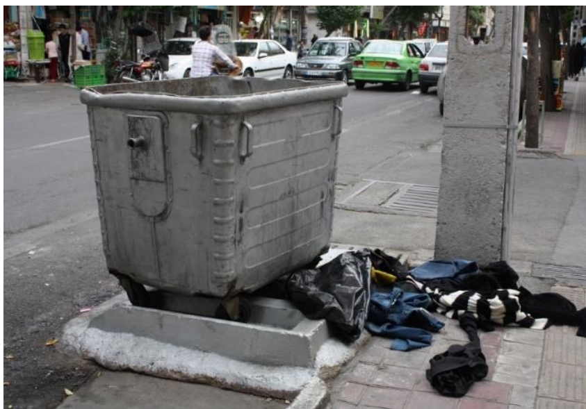
تصویر ۲- آلاینده‌ها/ منش آلوده‌کننده‌گان، خیابان ابوذر، شهرداری منطقه ۱۷ تهران.