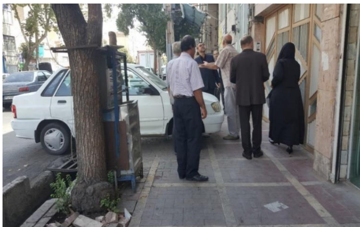
تصویر ۳- سواره‌محوری/تجاوز خودرو به حریم پیاده‌گشت، خیابان ابوذر، شهرداری منطقه ۱۷ تهران.

نکته مثبت و قابل اتکا در این مسئله اجتماعی و فرهنگی، میل به داشتن تغییر است؛ زیرا در مشاهده‌ها، تفاوتی آشکار میان بخش‌هایی از خیابان که عملیات به‌سازی و توانمندسازی در آن اجرا شده، با سایر قسمت‌ها نمایان است. محدوده‌های منتهی به بیمارستان ضیائیان و شهرداری منطقه ۱۷ به عنوان دو کنشگر قدرتمند در محور ابوذر، شاهدی زنده، پیش روی مخاطب است که تصویر خوشایند تأثیر معنابخشی به خیابان را هرچند در ابعاد کوچک و محدود به نمایش گذاشته است.