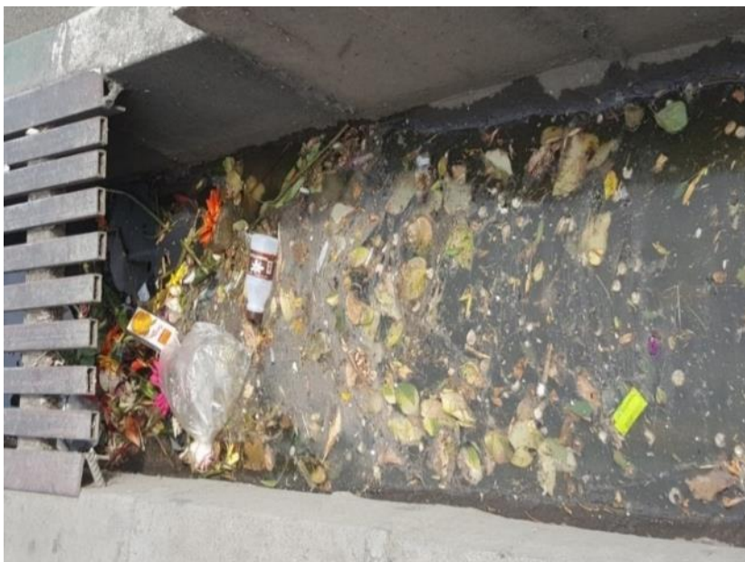
تصویر ۱- آلاینده‌ها/ منش آلوده‌کننده‌گان، خیابان ابوذر، شهرداری منطقه ۱۷ تهران.