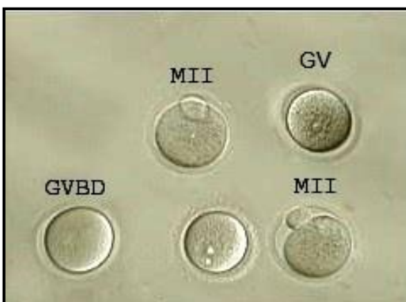
شکل ۲. مراحل مختلف بلوغ اووسیت. (بزرگنمایی: × ۱۰۰)

محیط کشت بیشتر از آنهایی است که در بدن قرار دارند (Halliwell, 2009).