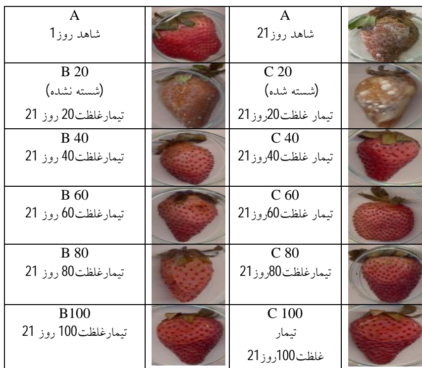
شکل 1- نمونه توت فرنگی در طی ماندگاری با اسانس

که این میزان 100 درصد عدم کپک زدگی در جدول 1 بیان شده است. حمید رنجبر و همکاران (1387) اثر اسانس گل های اسطوخودوس 1 ، بذور رازیان 2 و زیره سبز 3 و پیکره رویشی نعناع فلفلی 4 روی قارچ های عامل پوسیدگی و کپک زدگی پس از برداشت میوه توت فرنگی شامل Botrytis cinerea ، را بر افزایش ماندگاری بررسی کردند که اسانس زیره سبز به روش غوطه وری در کنترل پوسیدگی خاکستری میوه توت فرنگی بیشترین تاثیر را نشان داد و با قارچ کش تیباندازول (1/5 در هزار) به روش غوطه وری در یک گروه آماری قرار گرفت در صورتی که اسانس زیره سبز به روش محلول پاشی روی میوه در کنترل بیماری ناشی از R. stolonifer موثرتر بود.