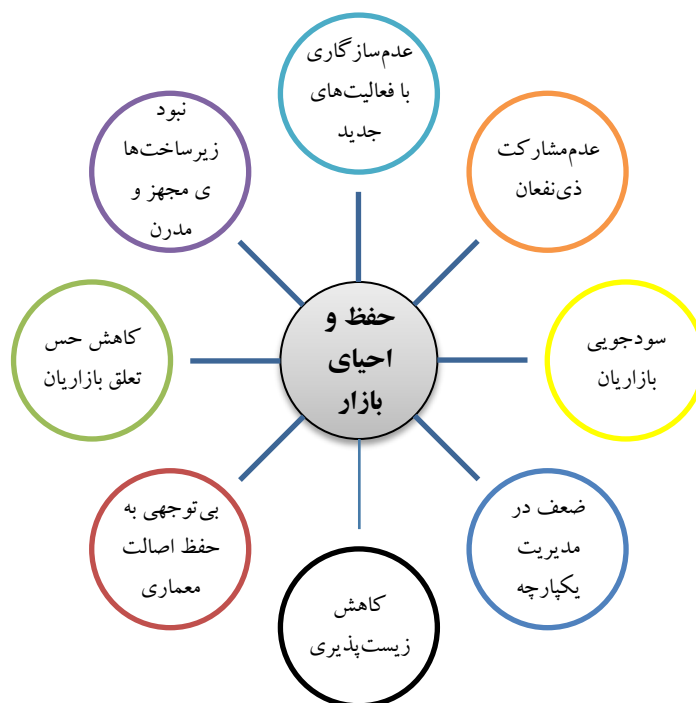
شکل شماره ۳. مدل مفهومی مقوله حفظ و احیای بازار تهران

شرایط فیزیکی و کالبدی بازار با سازه‌های چند صدساله‌اش، به‌طرزی محسوس در حال فرسوده‌شدن است. با این حال، مقامات شهری، برنامه‌ریزی جامع‌تربخشی برای حفظ و نوسازی بازار نداشته‌اند (کشاوریان، ۲۰۰۷: ۱۸۲). بعد از انقلاب، تلاش‌هایی برای تدوین و اجرای طرح‌های حفظ و احیای بازار تهران صورت گرفته اما بسیار کم تحقق یافته‌اند. عدم‌سازگاری بازار با فعالیت‌های جدید نسبت به مراکز خرید و نبود زیرساخت‌های مجهز و مدرن در این زمینه، کاهش حس تعلق بازاریان، ساخت‌وسازهای بی‌رویه در حاشیه بازار که با اصالت معماری بازار در تضاد است، همچنین کاهش زیست‌پذیری بافت اطراف بازار با مهاجرت ساکنان اصیل و بازاریان قدیمی و کاهش تمایل آنها به مشارکت در فرایند بازسازی و تمایل بازاریان به سرمایه‌گذاری در مراکز خرید جدید و سودجویی شهرداری در فقدان مدیریت یکپارچه، موارد مطرح‌شده در رابطه با مقوله حفظ و احیای بازار تهران‌اند که در شکل شماره ۳ نشان داده شده‌اند.