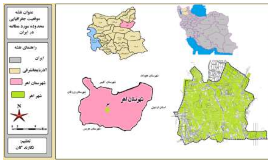
شکل شماره ۱: موقعیت جغرافیایی شهر اهر

روایی پرسشنامه بعد از تهیه پرسشنامه در اختیار تعداد ۱۵ نفر از کارشناسان و اساتید حوزه شهری قرار گرفته و پس از مطالعه و اخذ نظرات آنان سوالاتی که دارای اشکال بود طبق نظرات آنان مرتفع گردید. در تحلیل نهایی به وسیله SPSS از آمار توصیفی شامل میانگین، انحراف معیار و حداقل نمره و حداکثر نمره و فراوانی‌ها و درصد فراوانی استفاده گردیده است و با بهره گیری از آزمون‌های ضریب میانگین و آزمون T فرضیه پژوهش مورد آزمون قرار گرفت ضمناً سطح معنی داری بین متغیرها بدست آمد. برای پیشبرد پژوهش حاضر در راستای اهداف و فرضیات مطرح شده، پرسشنامه طراحی شده است. برای ارزیابی وضعیت پارکها که در سه گروه وضعیت مبلمان، خدمات فرهنگی و سایر متغیرها استفاده شده است (جدول شماره ۱)