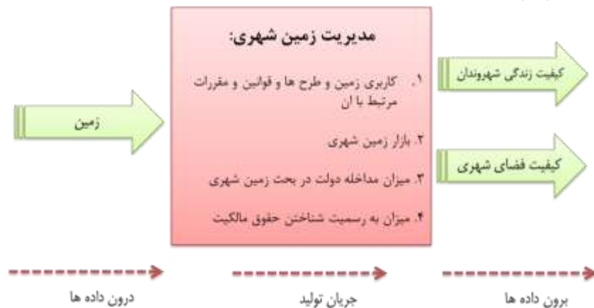
شکل شماره ۱: نظام مدیریت زمین شهری (مأخذ: نگارندگان با استفاده از فرآیند در کتب کاظمیان و سعیدی رضوانی ۱۳۸۰، ۵۶، کونتز و همکاران ۱۳۸۸، ۲۹)

درون داده، «زمین» است. در جریان تولید باید وضعیت کاربری زمین و طرح‌ها و قوانین و مقررات مرتبط با آن، بازار زمین شهری، میزان مداخله دولت در بحث زمین شهری و میزان به رسمیت شناختن حقوق مالکیت شناخته شده و در راستای نگرش سیستمی به تفکیک هدف، اجزا، روابط، محیط و منابع تحلیل شود و برون داده‌هایی چون کمیت و کیفیت زندگی شهروندان و کیفیت فضای شهری را که مجموعه ای از رفاه، امنیت و آسایش در فضای کالبدی و عملکردی شهر است، پدید آورد. بر این اساس با توجه به نگرش سیستمی، در این پژوهش ویژگی‌های سیستم با مجموعه اهداف، اجزا، روابط، محیط و منابع آن تعریف می‌شود، بنابراین با نگرش سیستمی به مدیریت زمین شهری، روش انتقال حقوق توسعه نیز بررسی می‌شود.