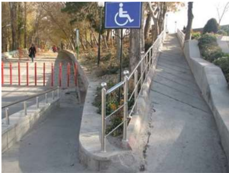
شکل (۱): نمونه ای از طراحی پارک برای معلولان در همدان.

دسترسی ایمن و آسان به پارک: نظر به ویژگی های گروه های مختلف معلولان، فضاها باید به نحوی طراحی گردد که امکان دسترسی سهل و آسان را برای آنان به راحتی فراهم آورده و بر سر راه آنان موانعی ایجاد ننماید. این تسهیلات صرف نظر از رعایت برخی نکات فنی و ضوابط مربوط به معلولان، شامل سادگی ارتباطات، احتراز از اختلاف سطح های غیر ضروری، تعبیه امکانات و مسیرهای ویژه است. پارک های عمومی باید به نحوی ساخته شوند که قابل استفاده برای تمام اقشار جامعه به خصوص معلولان باشند. معیار مطلوبیت یک محل برای فرد معلول، متناسب بودن محیط اطراف در ارتباط با نیازهای حرکتی و نحوه دستیابی هر چه آسانتر و سریعتر به محل مورد نظر است. به عنوان مثال اگر پارک در نزدیکی چهارراه های اصلی واقع شده باشد؛ ایمنی در دستیابی به آن نیز باید تأمین گردد. بنابراین خط کشی عابر پیاده در سواره رو، در کلیه تقاطع ها، حداکثر در هر ۵۰۰ متر امری الزامی است. به خصوص محل تردد معلولان باید مشخص شود. محل احداث پارک از نظر قابل دسترس بودن برای همگان و به ویژه معلولان حائز اهمیت است. بهتر است فضای سبز هر چند کوچک در نقاط نزدیک به مراکز نگهداری معلولان برای این دسته از معلولان احداث شود تا دسترسی این گروه به پارک در کمترین زمان ممکن و طی کوتاهترین فاصله انجام پذیرد. احداث پارک در نزدیکی مراکز نگهداری معلولان، به طوری که یک فرد معلول با پیمودن حداکثر ۴۰۰ متر بتواند از آن استفاده نماید، امری ضروری به نظر می رسد.