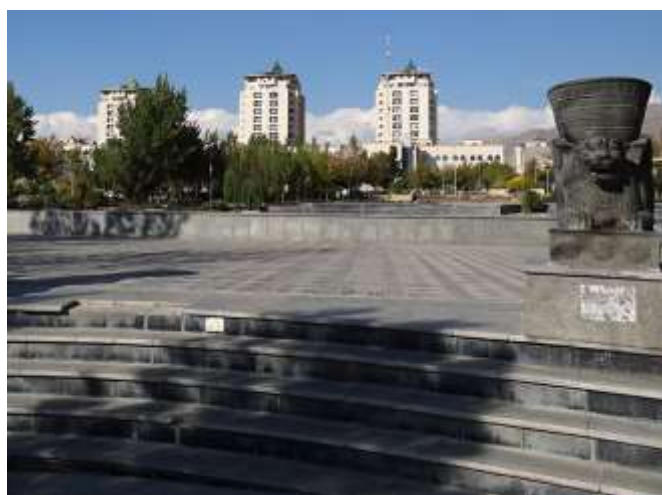
شکل (۴): از مشکلات عبور و مرور برای معلولین در پارک نبوت کرج.

با در نظر گرفتن موارد فوق می توان اظهار داشت که پارک نبوت، نظر به وسعت، قدمت و موقعیت خاص مکانی و نیز نزدیکی به برخی از مراکز مهم شهری، پتانسیل لازم جهت بهره مندی کامل از معیارهای فوق الذکر را دارا می باشد. عمده مشکلات این پارک در بخش سرویس های بهداشتی موجود در پارک از لحاظ کیفیت و کمیت به هیچ وجه دارای شرایط مطلوب معلولان نمی باشد که این امر قابل اصلاح می باشد.