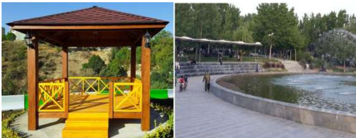
شکل (۳): نبود رامپ مناسب در پارک نبوت کرج.

با در نظر گرفتن موارد فوق می توان اظهار داشت که پارک نبوت، نظر به وسعت، قدمت و موقعیت خاص مکانی و نیز نزدیکی به برخی از مراکز مهم شهری، پتانسیل لازم جهت بهره مندی کامل از معیارهای فوق الذکر را دارا می باشد. عمده مشکلات این پارک در بخش سرویس های بهداشتی موجود در پارک از لحاظ کیفیت و کمیت به هیچ وجه دارای شرایط مطلوب معلولان نمی باشد که این امر قابل اصلاح می باشد.