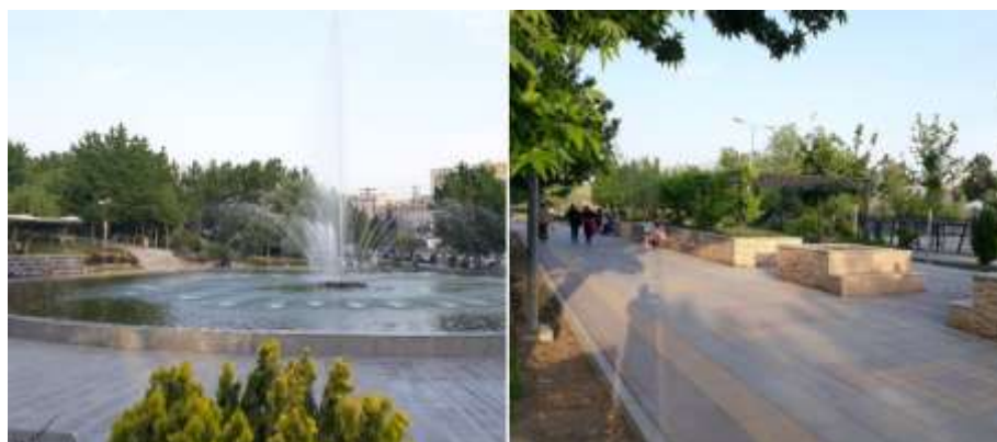
شکل (۲): نمایی از پارک نبوت کرج.