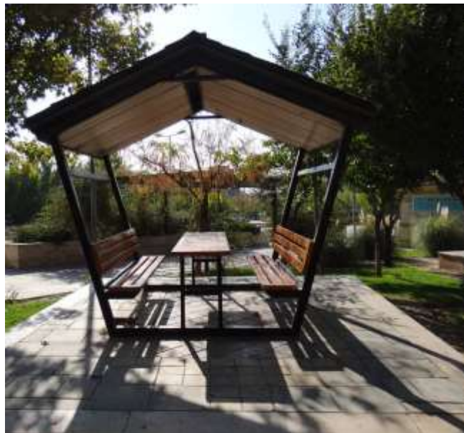
شکل (۵): عرض کم برای ورود ویلچر معلولین در پارک نبوت کرج.