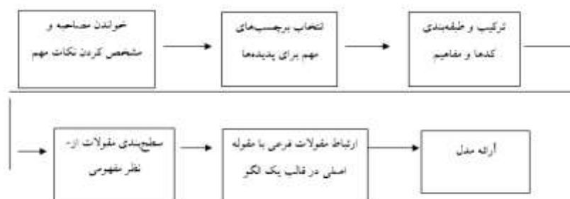
شکل 1- فرایند انجام و تکمیل تجزیه و تحلیل داده‌های تحقیق

موجود استفاده از تجارت الکترونیک در بخش تولیدات محصولات آموزشی» آغاز شد و باقی پرسش ها بر اساس پاسخ های مصاحبه شونده طرح گردید. در شکل شماره (1) مسیر انجام و تکمیل تجزیه و تحلیل داده‌ها در تحقیق حاضر آمده است.