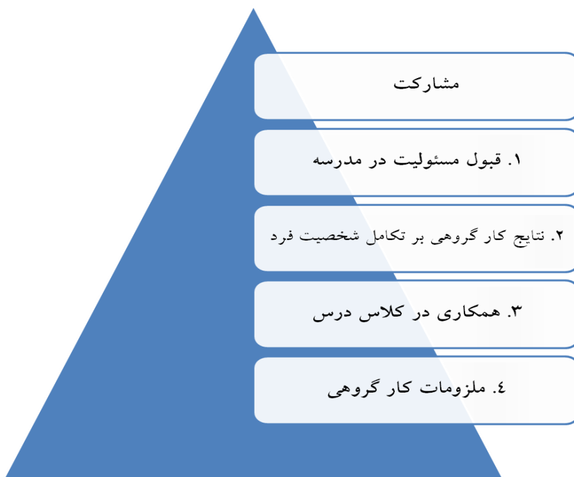
شکل ۲- مشارکت

نتایج حاصله حاکی از آن است که دانش آموزان تجارب فراوانی در رابطه با مشارکت به عنوان یکی از مولفه‌های تربیت شهروندی دارند که با نتایج وزیری و جهانی (۱۳۸۵) در اولویت بندی مهارت‌های شهروندی مورد نیاز دانش آموزان دبستان‌های شهرستان زلزله زده ی بم، مهارت‌های شهروندی مورد نیاز دانش آموزان در شرایط یاد شده را به ترتیب زیر اولویت بندی کرده اند: ۱. مهارت‌های حل مساله ۲. مهارت تصمیم گیری ۳. مهارت روابط موثر اجتماعی ۴. مهارت رویارویی با هیجان و استرس ۵. مهارت شهروند جهانی بودن ۶. مهارت تفکر انتقادی ۷. مهارت‌های اقتصادی در اداره ی زندگی ۸. مهارت بکار بردن نکات ایمنی ۹. بهداشت جسمی ۱۰. مسئول بودن و همدلی که از الزامات فوری تربیت شهروندی دانسته شده است.