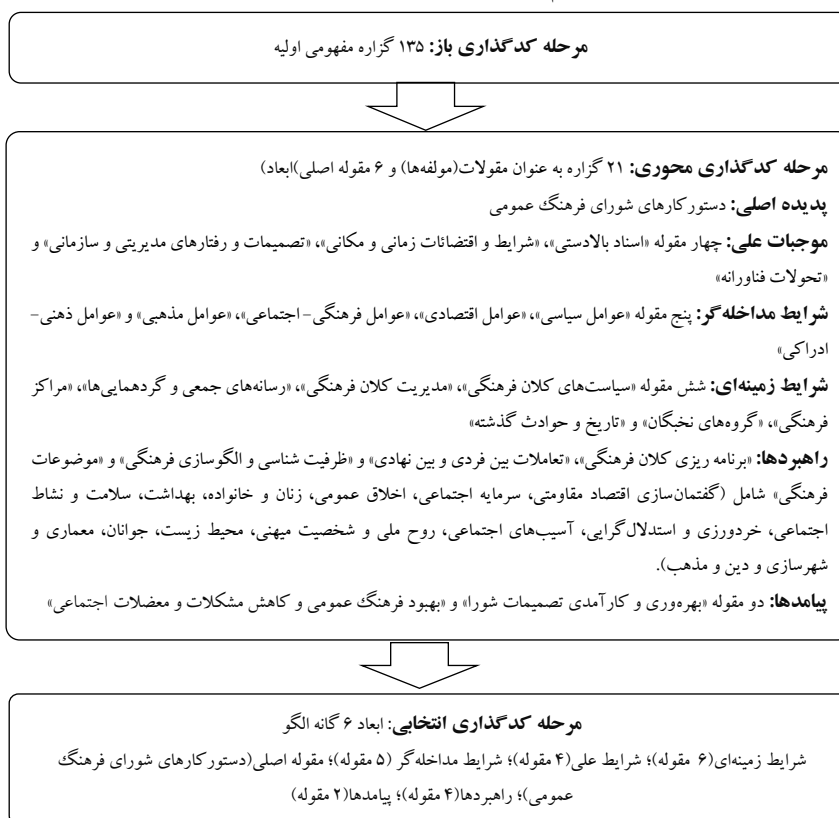
شکل (۱): الگوی مفهومی؛ (یافته‌های محقق).

بنابراین یکپارچه سازی تدوین دستور کارهای شورای فرهنگ عمومی از طریق توجه به مقوله‌های مختلف شرایط زمینه، شرایط مداخله گر، شرایط علی، راهبردها و پیامدها قابل تحقق است. براساس مفاهیم و مقوله‌های استخراجی از مراحل قبل، روایتی از نحوه بکارگیری سایر عوامل موثر بر دستور کارهای شورای فرهنگ عمومی کشور تشریح شده است که به صورت شماتیک (شکل ۱) به عنوان الگوی مفهومی پژوهش ترسیم شده است.