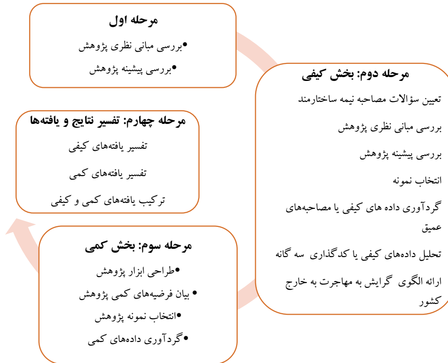
شکل شماره (۲) مراحل انجام پژوهش بر اساس رویکرد آمیخته

روش تحقیق حاضر، روش آمیخته ۱ بوده و از نظر هدف کاربردی و از نظر شیوه گردآوری داده های ترکیبی از نوع اکتشافی ۲ است که شامل دو مرحله عمده کیفی - کمی ۳ است. در مرحله اول از نظریه داده بنیاد ۴ (گراند تئوری) به عنوان رویکرد کیفی استفاده شد که روند مصاحبه ها تا اشباع