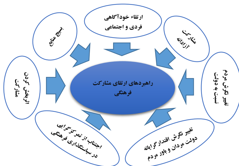
شکل ۱: راهبردهای ارتقای مشارکت فرهنگی در تولید محتوای فضای مجازی

..... طراحی مدل راهبردی ارتقای مشارکت فرهنگی سازمان های مردم نهاد