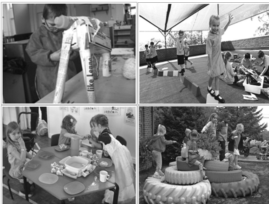
شکل ۲: بازی سبب شکوفایی خلاقیت می شود