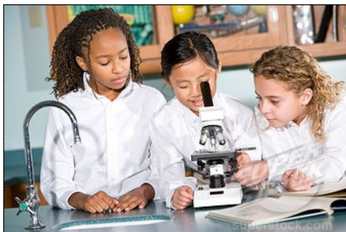
شکل ۱: کودکان کنجکاوند

کودک قرار گیرد، ارزشهای تربیتی فرصت مناسب تری می یابد. بر عکس، اگر محیط در جهت انحراف فکر و رفتار کودک باشد، وی را از تربیت مطلوب باز می دارد (معیری، ۱۳۸۰: ۱۵۴). ژان پیاژه نظریه پرداز سوئیسی، کودکان را کاوشگران پرکار و با انگیزه ای میدانست که با عمل کردن مستقیم روی محیط، تفکر خود را پرورش می دهند (برک، ۱۳۸۰: ۲۱۴). ایجاد محیطهای یکنواخت، خشن، ملال آور و همراه با عوامل مساله برانگیز، برای کودک به همان اندازه اهمیت دارد که ایجاد فضاهای باز، در کنار طبیعت، میل به یک زندگی اجتماعی سالم، همراه با قصه پردازی و شعر و موسیقی و هیاهو بر او تأثیر می گذارد (شیعه، ۱۳۸۵: ۲۰). کودک ممکن است از روی کنجکاوای و ساده دلی به هر سویی برود. درک او از فضای پیرامون همان است که خود تصور می کند. بنابراین باید فضای زیست سالمی را برای او فراهم آورد تا علائق منطقی او فرصت شکوفایی داشته باشد (بوالهروی، ۱۳۷۹: ۱۴). از نظر تربیتی، به منظور ساختن کودک در فضای اجتماعی شهر، باید سه جنبه اساسی حواس، تخیل و شخصیت کودک را مورد توجه قرار داد (رضویان، ۱۳۷۹: ۷۸). چنین شرایطی را باید بدون دخل و تصرف در شرایط اساسی کودک به وجود آورد (شیعه، ۱۳۸۵: ۳۸). در تربیت ذهنی و روانی کودک نباید مسایلی مانند اضطراب و ترس راه داشته باشد. وجود چنین عواملی در کودکان ریشه در تجارب وسیع و گوناگون آنان در طول زندگیشان دارد (داگلاس، ۱۳۷۹: ۲۷).