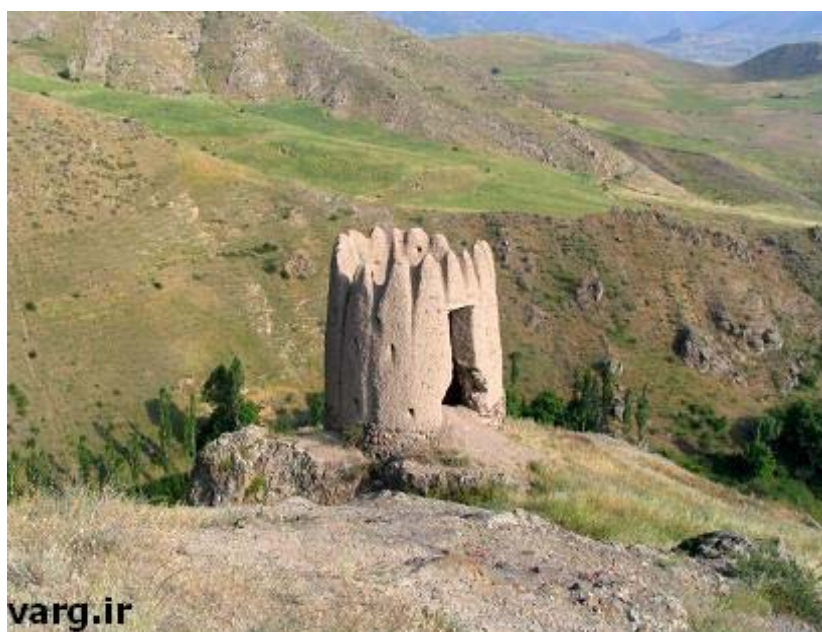
شکل شماره ۷ - عکس برج گرماور که در ضلع غربی روستای گرماور واقع شده است.