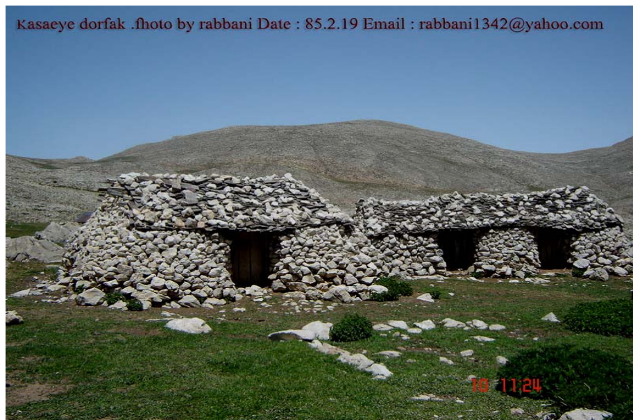
شکل شماره ۶ - عکس خانه های سنگی درفک که در ارتفاعات درفک قرار دارد.

آب وهوا، جنگل ومراتع، چشمه ها (لاریخانی، چشمه گوته بن، چشمه لاوار..)، رود ها، آبشارها (آبشارلونک، آبشار ملومه، آبشار بابا ولی) برکه ها (برکه خونین سل، نفتی سل) کوهستانه و نواحی بیلاقی، غارهای طبیعی (غار درفک، غارملومه، غار تله گلو، غار کوتیل، غار طالشکوه) پدیده طبیعی (بشکافته سنگ) (شکل شماره ۶).