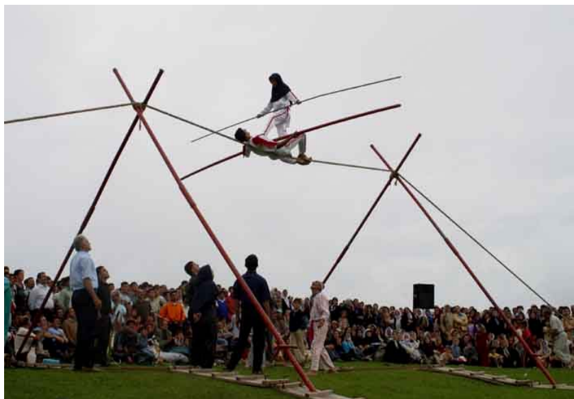
شکل شماره ۸ - عکس لافند بازی که از بازیهای محلی منطقه می باشد.

شامل لافند بازی، کشتی گیله مردی، قیش بازی... (شکل شماره ۸).