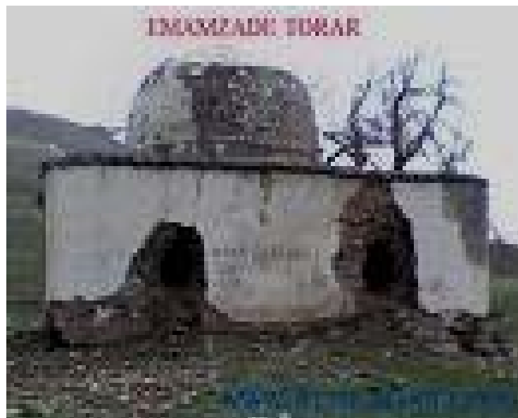
شکل شماره ۳ - عکس امامزاده تورارکه در ارتفاعات روستای جلیسه از توابع دهستان پیرکوه قرار دارد.