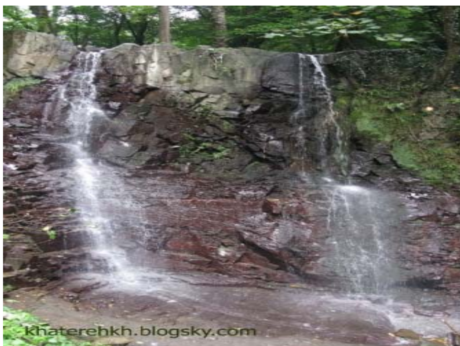
شکل شماره ۴ - عکس آبشار لونک دیلمان که در جنوب شهر سیاهکل قرار دارد.

*پارک جنگلی لونک، یکی از مهمترین اهداف ایجاد پارک جنگلی در درجه اول حفظ و حمایت از گونه های جنگلی در مقابل قطع و بهره برداری غیرمجاز و جلوگیری از تجاوز به عرصه های منابع ملی و کاهش عرصه های تجاوزی و همچنین حفظ آب و خاک و پوشش گیاهی و جلوگیری از فرسایش آن در مراحل بعدی توسعه صنعت گردشگری و غیره می باشد.