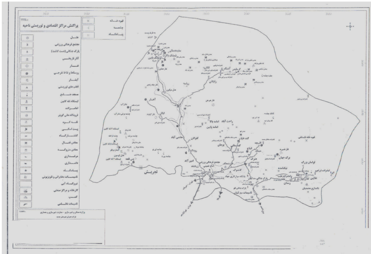
شکل شماره ۲: نقشه پراکنش مراکز اقتصادی و توریستی ناحیه

جاذبه‌های گردشگری ناحیه به قرار زیر است: