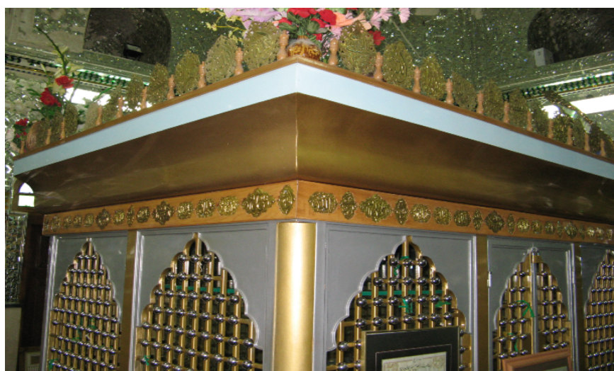
شکل شماره ۶: امامزاده فضلعلی محله ناران لواسان کوچک

در منتهی الیه شرق شهر لواسان کوچک و در ضلع جنوبی محله ناران و حمام تاریخی آن و در جنوب تکیه جدیدالاحداث محله قرار دارد. دارای گنبد پیازی شکل است قدمت آن متعلق به قرون هفت و هشت هجری است این اثر ارزشمند در مهرماه سال ۱۳۸۲ تحت شماره ۱۰۳۷۳ در فهرست آثار ملی به ثبت رسیده است. بنابر متن زیارتنامه نصب شده در داخل بقعه امامزاده نسبت آن بزرگوار فضلعلی ابن موسی الکاظم قید شده و گفته شده از امامزادگان معتبر و دارای شجره قطعی می‌باشد.