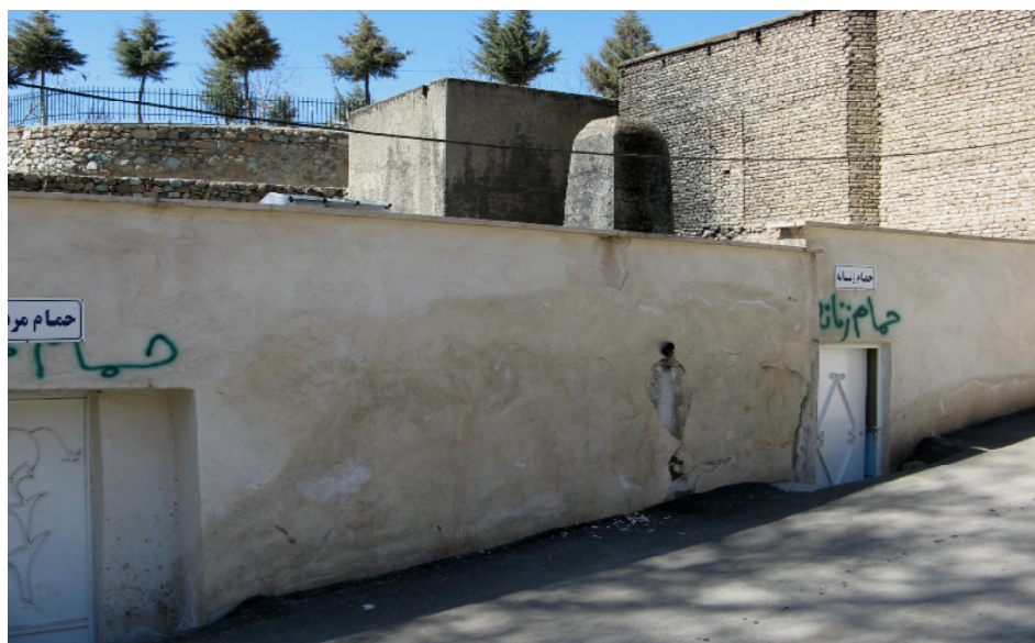
شکل شماره ۵: حمام تاریخی افجه لواسان

در مرکز روستای افجه حمام تاریخی افجه قرار دارد که دارای دو بخش مجزای مردانه و زنانه بوده و ورودی هر دو از سمت شمال می‌باشد. دارای طاق و تویزه و گنبد‌های عرقچین و ستونهای جناغی می‌باشد. قدمت آن به اواخر دوره صفویه یا اوایل حکومت قاجار تعلق داشته است و همچنان تمیز و مرتب مورد استفاده اهالی می‌باشد.