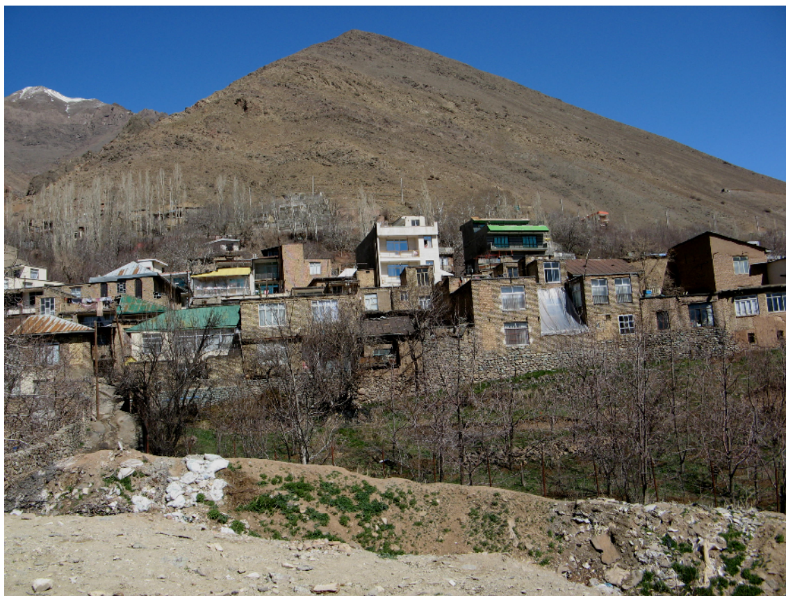
شکل شماره ۱: نمایی از روستای افجه لواسان