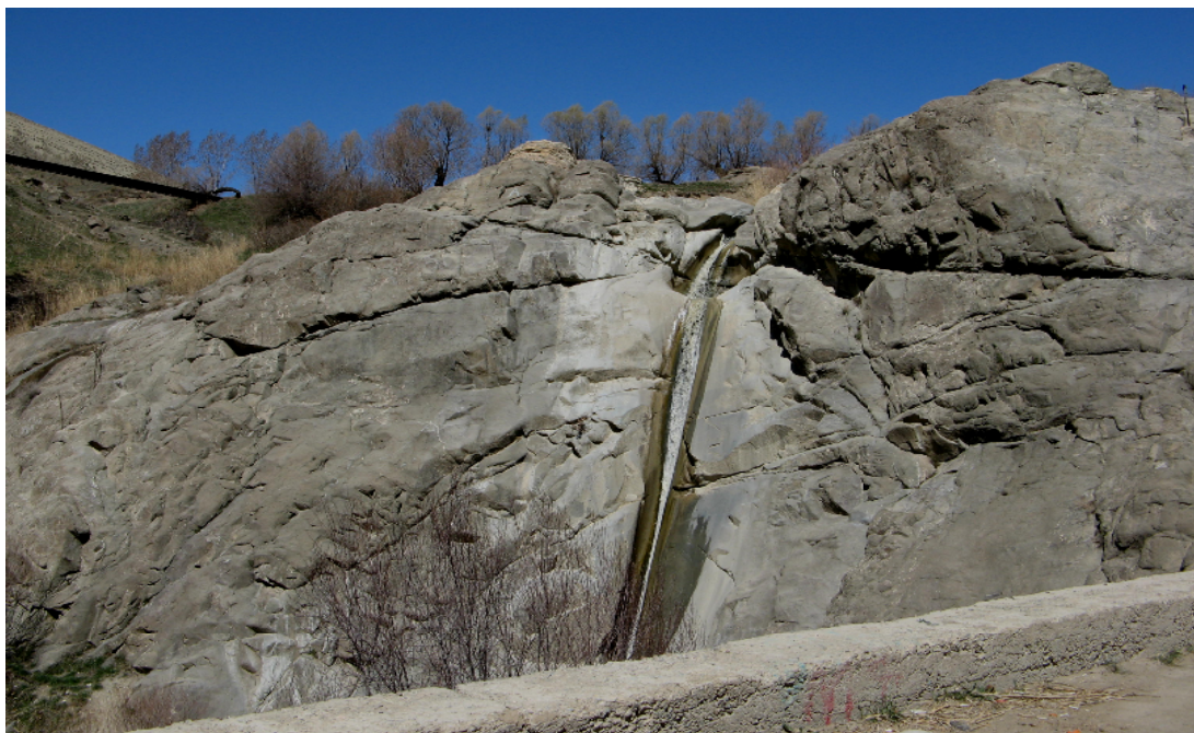
شکل شماره ۳: نمایی از آبشار پسچویک

آبشار پسچویک: در فاصله حدود ۱/۵ کیلومتری شمال شرق روستای افجه و در جبهه شرقی یالی از کوه که به ناحیه دشته و نهایتاً دشت هویج منتهی می‌شود و در موقعیت جغرافیای ۳۵ درجه و ۵۲ دقیقه و ۲۸ ثانیه عرض جغرافیایی و در ۵۱ درجه و ۴۲ دقیقه و ۱۸ ثانیه طول جغرافیایی و در ارتفاع ۲۲۴۶ متر از سطح دریا، آبشار زیبایی وجود دارد که اهالی افجه آن را پسچویک می‌نامند. ارتفاع آبشار پسچویک حدود ۱۵ متر بوده و اطراف آن را درختان بلندی پوشانده است. آب جاری از این آبشار دائمی است و منظره بسیار زیبایی را بوجود آورده است.