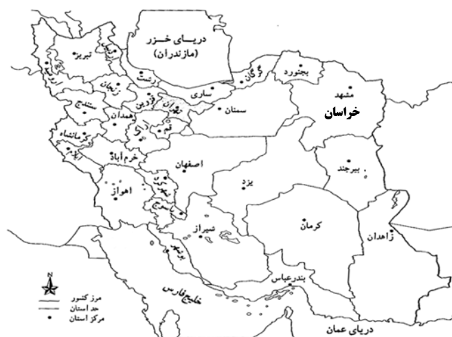
شکل شماره ۱- نقشه تقسیمات کشوری جمهوری اسلامی ایران به تفکیک استان