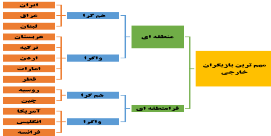
نمودار شماره ۲: مهمترین بازیگران خارجی سوریه