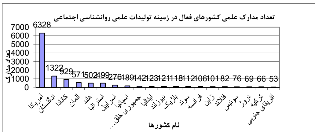
نمودار ۲- کشورهای فعال در زمینه تولیدات علمی روانشناسی اجتماعی در پایگاه وب آو ساینس طی سال‌های ۱۹۹۰-۲۰۰۹